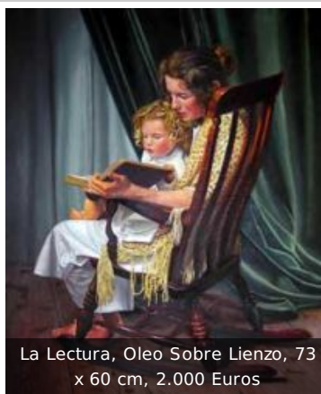
La Lectura, Oleo Sobre Lienzo, 73 x 60 cm, 2.000 Euros